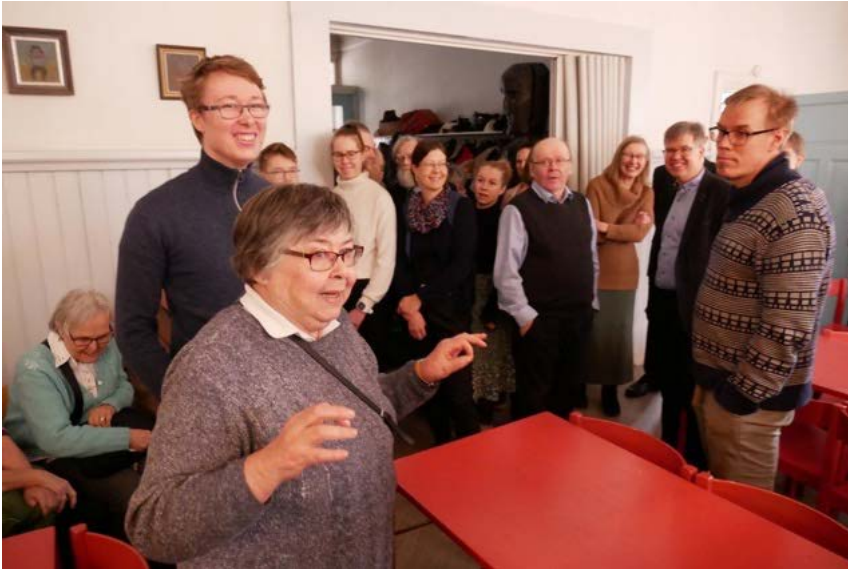
Pirkolla on tärkeää asiaa