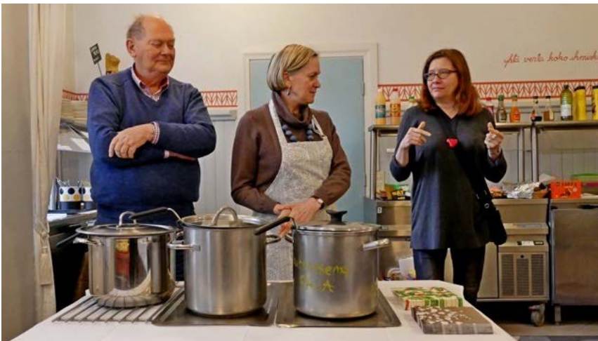
Sopat ovat valmiina. Tyytyväiset