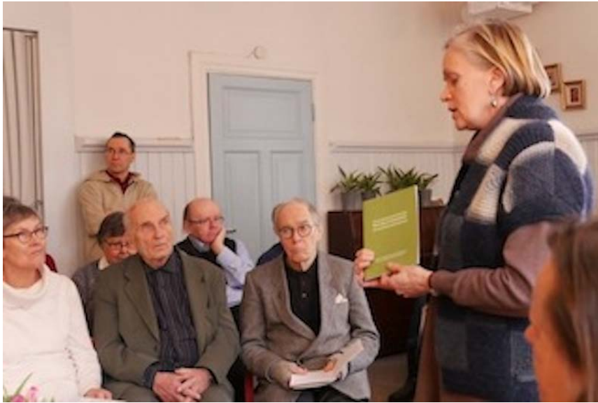
Hartauskokous on alkamassa